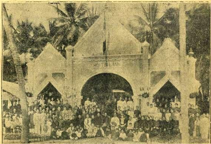
NHÀ-THỜ MỚI CỦA CHI-HỘI TÂN-THẠCH

được phước nhiều. Cũng có ba đêm bố-đạo cho người ngoại, họ cũng đến dự mỗi đêm chừng 150 người, nhưng chưa kết-quả.