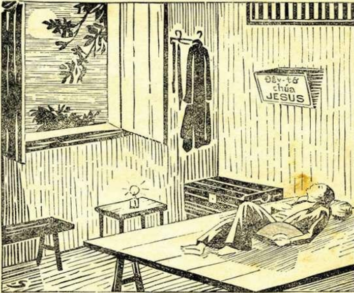
Trời sáng trắng, em Kiên ngược mắt đọc tẩm hiền

đi thất-tha thất-thểu, thì cô Hiệp động lòng thương đến nỗi ứa hai hàng nước mắt. Cô đưa em về nhà mình, khuyên-bảo cặn-kẽ, lại hết lời yên-ủi và giục lòng em. Cô giữ em ở lại ăn cơm, rồi cho em một bộ quần-áo và ba chiếc mũ-xoa của cô định cho em từ trước.