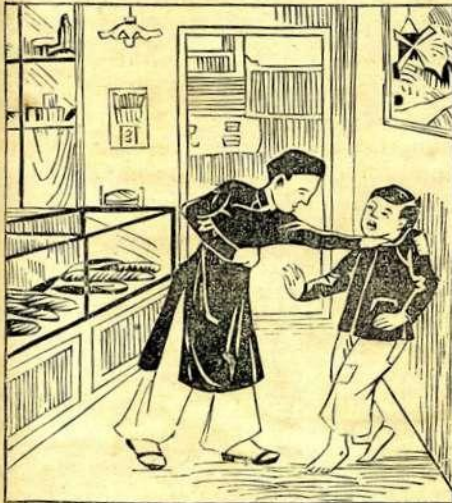
Ông Ban đánh cậu Ba

thường có ân-núp những sự gian-trá, xảo-quyệt. Ông lấy bột khoai trộn vào bột mì để làm bánh, hầu cho tốn tiền ít mà có lợi nhiều. Những bạn hàng của ông lâu ngày thấy rõ cách làm dè-tiện ấy, bèn gạn hỏi cậu Ba.